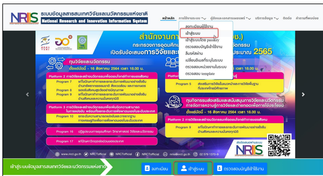
รูปภาพที่ 1 หน้าเข้าสู่ระบบ